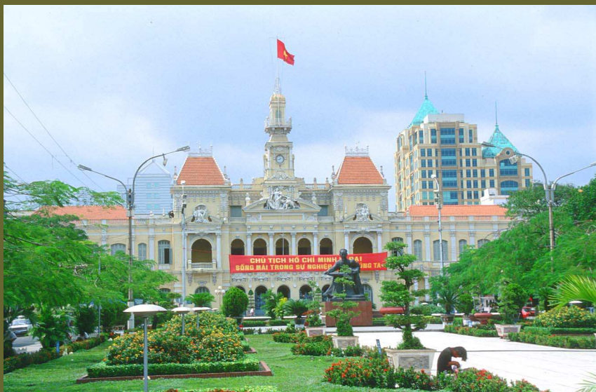
Ho Chi Minh (Saigon)