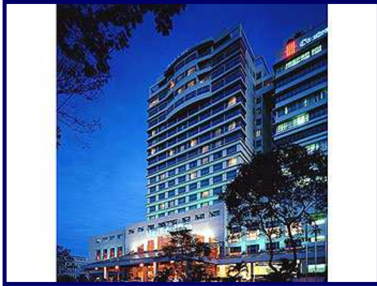
Hotel Sofitel Plaza