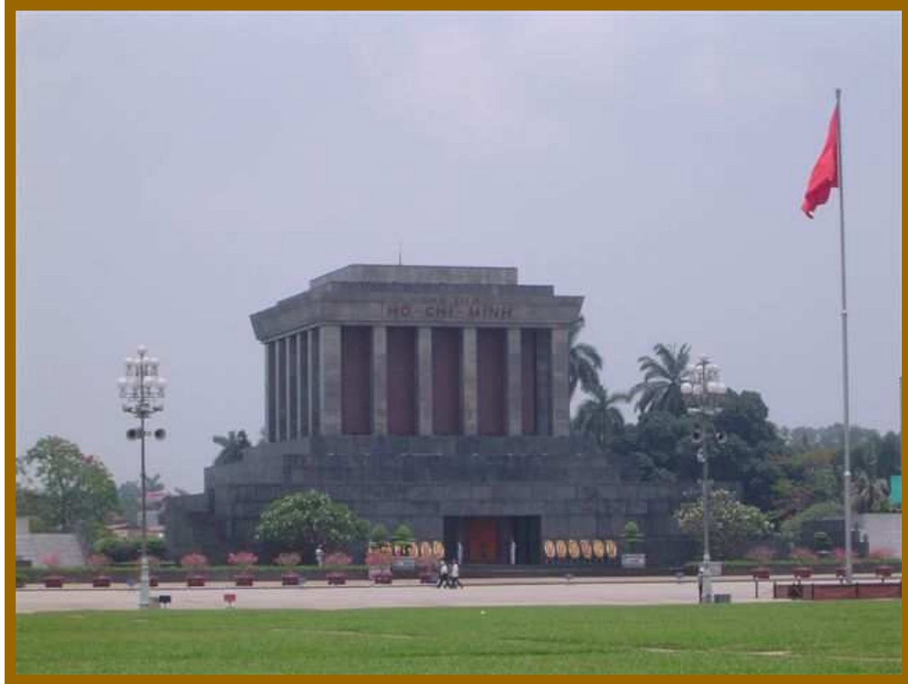
Mausoleo a Ho Chi Minh, Hanoi.