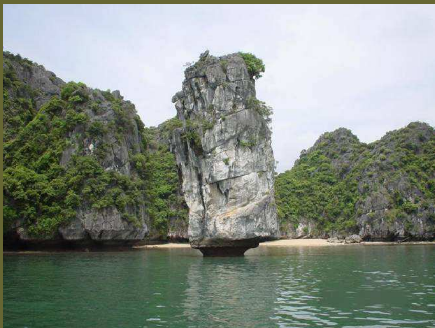
Bahía de Halong