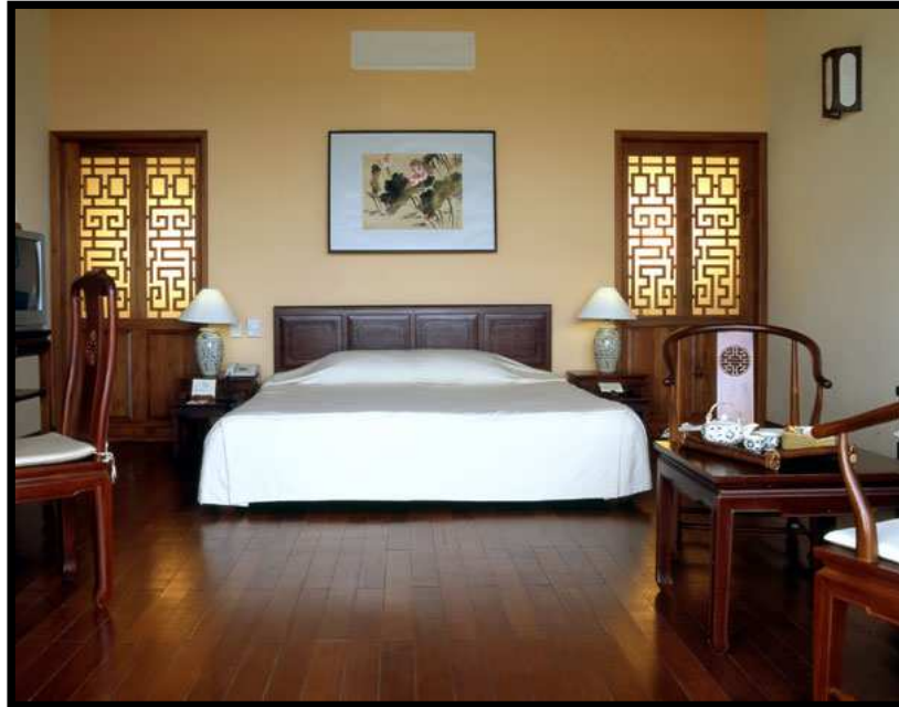
Hoian Beach Resort & Spa