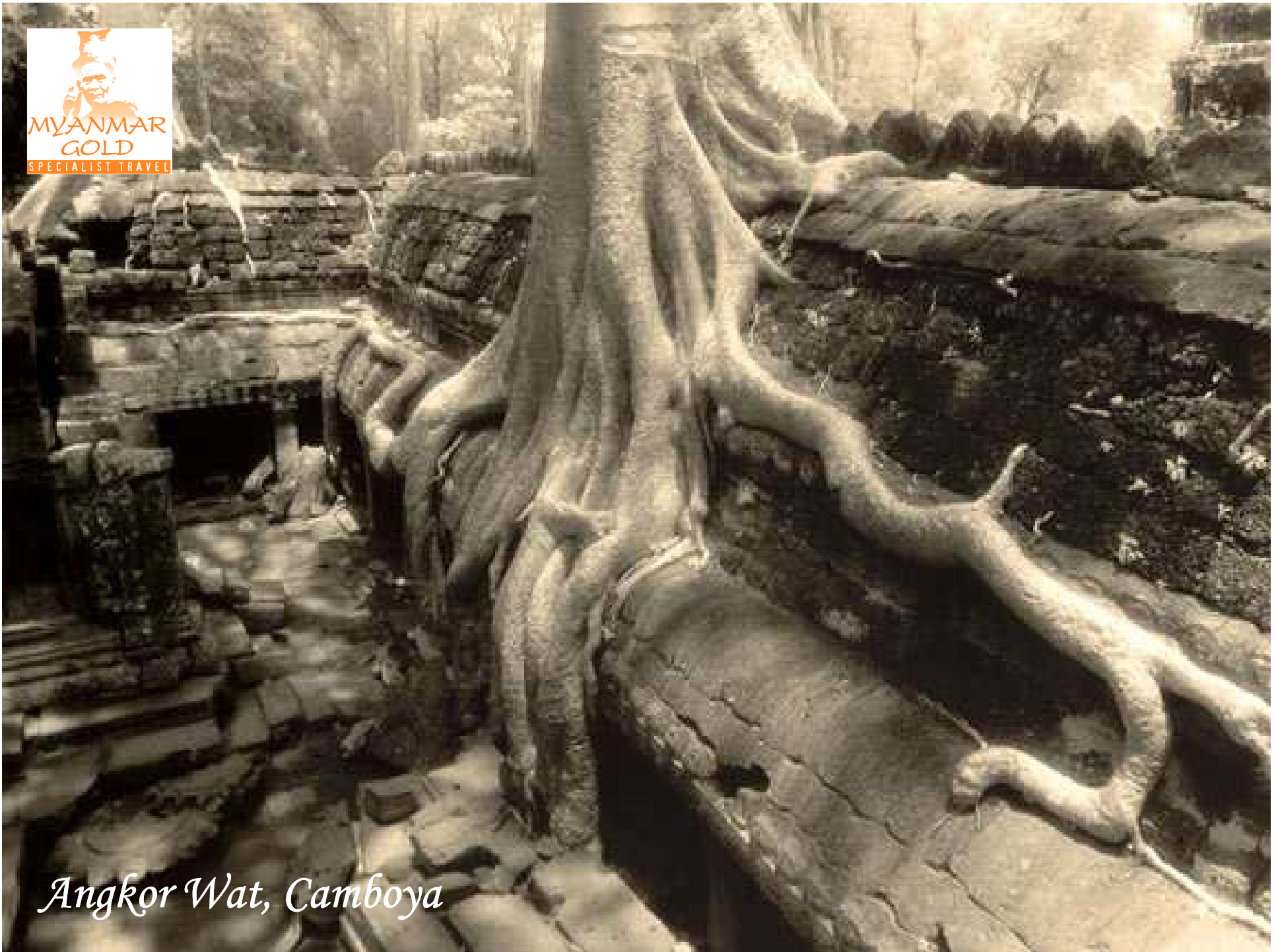
Angkor Wat, Camboya