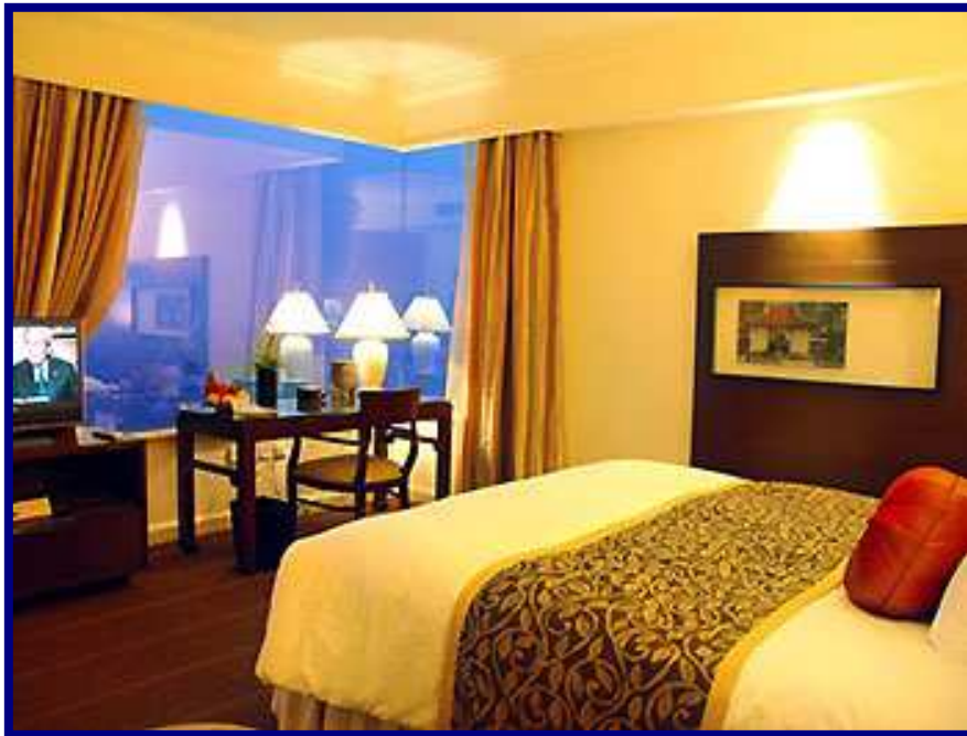
Hotel Sofitel Plaza

Situado en el Distrito de Ba Dinh, con más de 20 plantas, desde las cuáles podremos observar el West Lake, Sofitel Plaza Hanoi es un alojamiento en la línea habitual de la cadena sofitel, sin grandes lujos, aunque seguros de que no vamos a tener ningún inconveniente en sus instalaciones, modernas y cómodas, desde las cuáles comenzaremos nuestras primeras visitas a la capital del país.