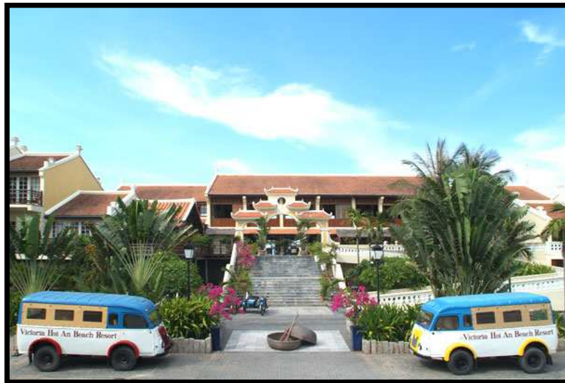
Hoian Beach Resort & Spa